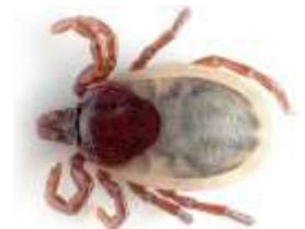
Κρότωνες ή (τσιμπούρια)