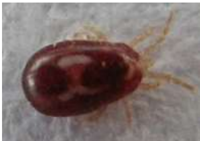
Απομυζητικά ακάρεα, ( Dermanyssus gallinae )