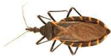
Kissing Bug Νόσος Chagas