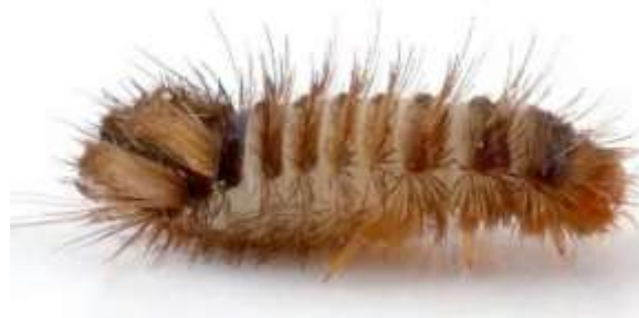
Σκαθάρια των χαλιών